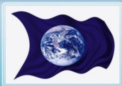
Эмблема и флаг Международного Дня Земли

Основателем этого Дня считается Дж. Стерлинг Мортон, который в 40-х годах XIX века развернул кампанию по пропаганде посадки деревьев в штате Небраска /США/. Предложение Дж. Мортон было одобрено и получило широкую поддержку жителей штата: в первый День Дерева было высажено около миллиона деревьев. В 1882 г. День